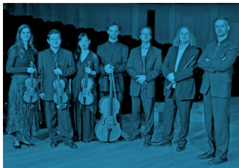
il Gardellino