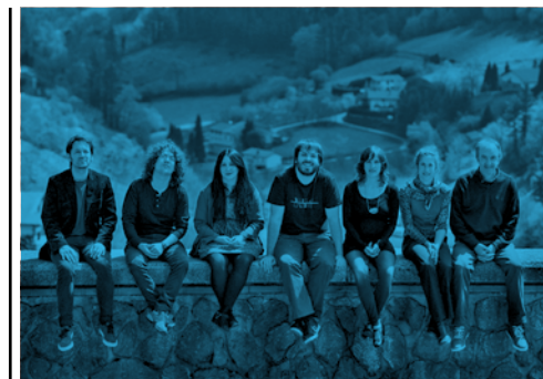
Euskal Barrokensemble