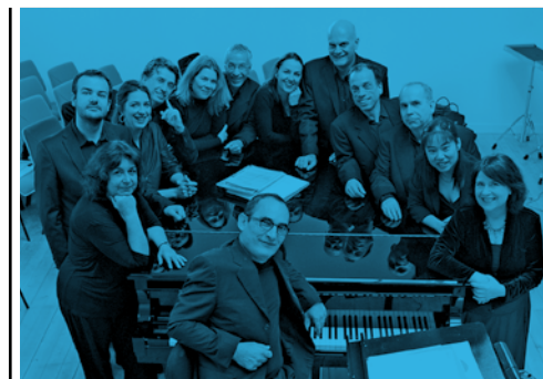
Musicatreize © Jean-Baptiste Millot

Organisatie i.s.m. Gemeente Westerlo en Norbertijnenabdij Tongerlo