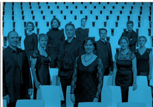
Vocal Consort Berlin

Organisatie i.s.m. Cultuurcentrum Mechelen en Stad Mechelen In het kader van Op.Recht.Mechelen