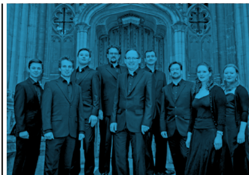
Contrapunctus