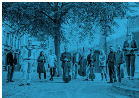
Ensemble Clematis

Organisatie i.s.m. Gemeente Sint-Katelijne-Waver en vzw Wintertuin. In het kader van Op.Recht.Mechelen