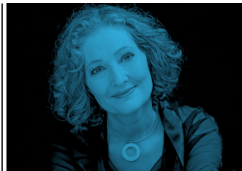
Emma Kirkby